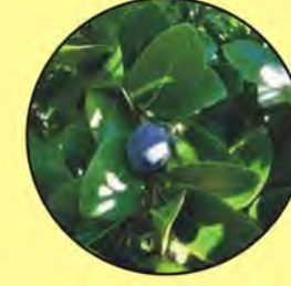
9 Chrysobalanus icaco icaco cocoplum