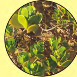
5 Scaevola plumieri borbón inkberry