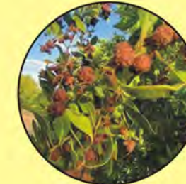
10 Conocarpus erectus mangle botón buttonwood