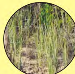
4 Spartina patens yerba de sal salt meadow cordgrass