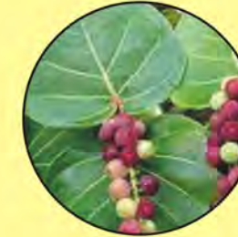
7 Coccoloba uvifera uvero sea grape