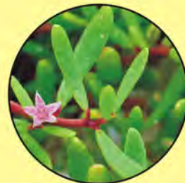
3 Sesuvium portulacastrum verdolaga rosada sea purslane