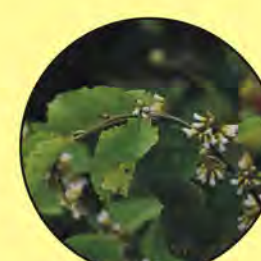
8 Dalbergia ecastaphyllum maraymaray coin vine