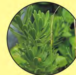
6 Suriana maritima temporana bay cedar