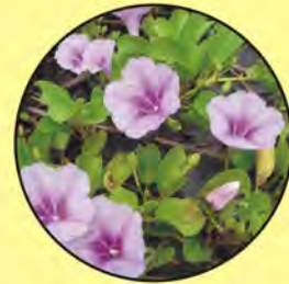
1 Ipomea pes-caprae batata o bejuco de playa beach morning glory

Crinum asiaticum , lirio de mangle, Asiatic swamp lily Dactyloctenium aegyptium , yerba de Egipto, Egyptian grass Scaevola taccada , naupaka, beach naupaka Yucca aloifolia , aguja de Adán, dagger plant Cocos nucifera , palma de cocos, coconut palm Casuarina equisetifolia , pino Australiano, Australian pine Terminalia catappa , almendro, almond tree Hibiscus mutabilis , emajagua, sea hibiscus