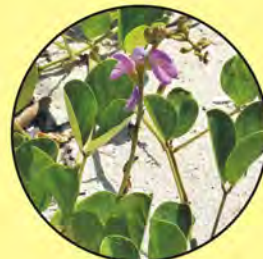
2 Canavalia rosea haba de playa beach bean